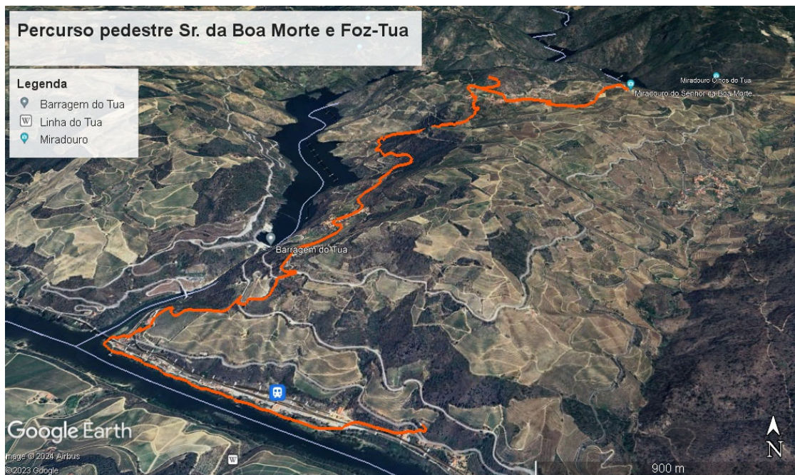
Imagem 2 – Percurso da caminhada de Sr. da Boa Morte e Foz-Tua

Ponto de partida da caminhada: Santuário do Sr. da Boa Morte