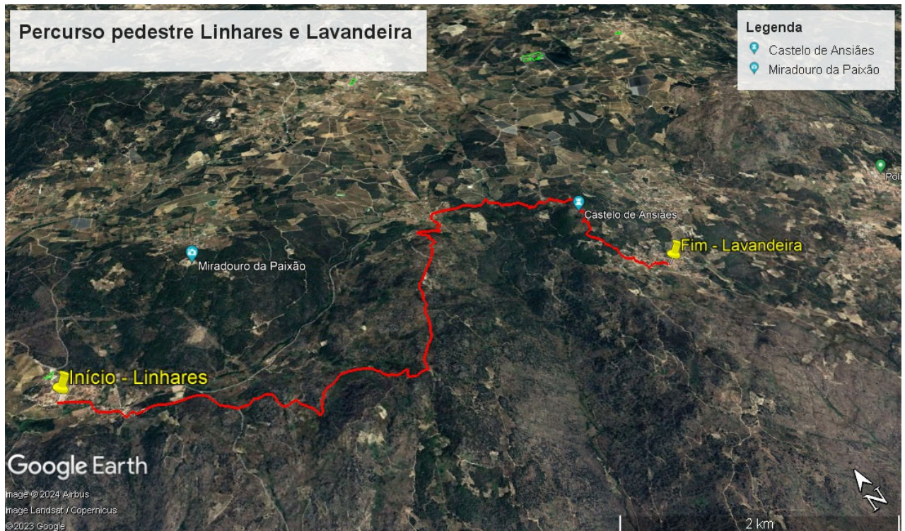
Imagem 2 – Percorso da caminhada Linhares e Lavandeira