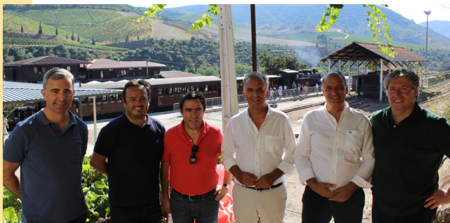
Comboio Histórico do Douro volta a circular

Este ano, o dia da Unidade Pastoral foi celebrado de forma diferente com a realização de uma missa campal no recinto da feira municipal, respeitando as regras impostas pela DGS.