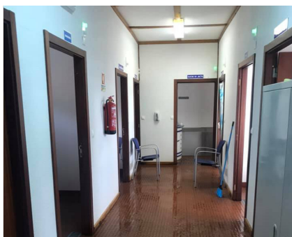
Abertura das Caldas de S. Lourenço, 10 de Agosto

Este ano especialmente devido à pandemia da COVID-19, foram implementadas algumas medidas para salvaguardar a segurança e higiene neste espaço.