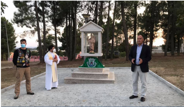
Inauguração do Nicho de São Rafael 29 de Setembro de 2020

Como forma de celebração, o município inaugurou um nicho dedicado a São Rafael, em Homenagem aos Motociclistas de Carrazeda de Ansiães.