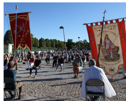
Celebração de Santa Águeda, 30 de agosto

Este passaporte contabiliza 41 instituições públicas e privadas da região duriense para os visitantes partirem à descoberta da nossa região.