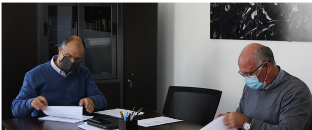
Município investe na Rota do Douro

Ao Longo de 275 quilómetros pode-se pedalar por vinhas, natureza e arte no território duriense dos setes concelhos: Carrazeda de Ansiães, Figueira de Castelo Rodrigo, Freixo de Espada à Cinta, Miranda do Douro, Mogadouro, Torre de Moncorvo e Vila Nova de Foz Côa.