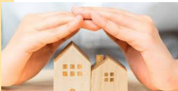
Apoio à melhoria de habitação

No âmbito das competências do Serviço de Ação Social e inserido nas Estratégias de Apoio à Comunidade, o município tem o regulamento de apoio municipal aos extratos sociais desfavorecidos, área de habitação. Este projeto tem como objetivo a execução de pequenas reparações em casas de primeira habitação, desde que cumpram os requisitos de elegibilidade e tem um teto máximo de 5.000,00€.