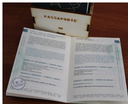
A Rede de Museus do Douro lança o MUD Passaporte

Este ano especialmente devido à pandemia da COVID-19, foram implementadas algumas medidas para salvaguardar a segurança e higiene neste espaço.