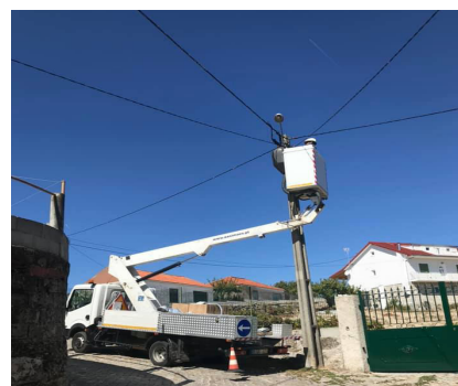
Eficiência Energética - Instalação de Luminárias LED

No dia 23 de julho, em Campelos celebrou-se a festa em honra de Santo Apolinário e foi este o dia escolhido para se apresentarem as obras de restauro da Capela.