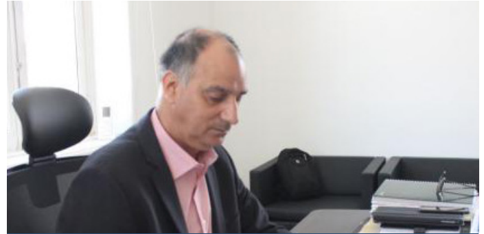
Município de Carrazeda de Ansiães vai ter dois regulamentos de apoio à fixação de jovens no concelho.

Como forma de celebração, o município inaugurou um nicho dedicado a São Rafael, em Homenagem aos Motociclistas de Carrazeda de Ansiães.