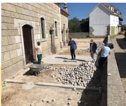
Preservação do Património Religioso

A requalificação avaliada em 156.000,00€ pretende beneficiar o troço de estrada que liga o concelho de Carrazeda de Ansiães à localidade de Folgares.